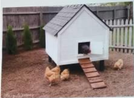
ŠLI SPOLU DOMŮ DO KURNÍKU A TAM SI DLOUHO POVÍDALI. DOMA S NIMI ODPOČÍVALY PO DLOUHÉM DNI I DALŠÍ SLEPIČKY.